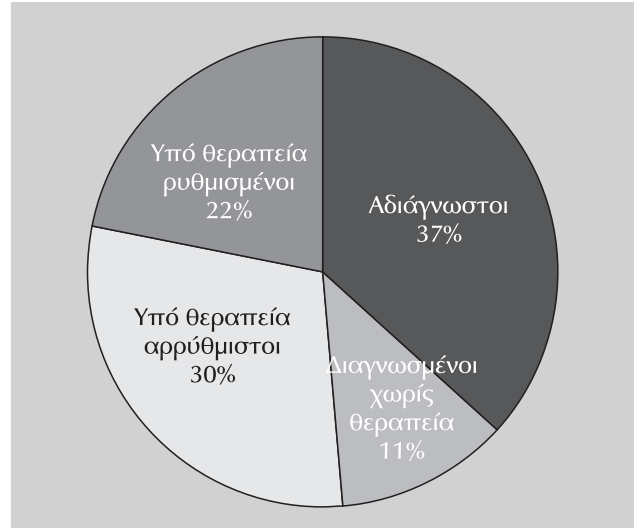
Εικόνα 1. Ποσοστά αναγνώρισης, θεραπείας και ρύθμισης της υπέρτασης σε μελέτες στην Ελλάδα.

Η υπέρταση είναι εξίσου συχνή στη χώρα μας όσο και σε άλλες αναπτυγμένες χώρες και αφορά περίπου στο 25% του πληθυσμού των ενηλίκων. Τα ποσοστά αναγνώρισης, θεραπείας και ρύθμισης της υπέρτασης στη χώρα μας (εικ. 1) είναι παρόμοια με αντίστοιχα ερευνών σε πληθυσμούς άλλων αναπτυγμένων χωρών. Πολλοί αγνοούν ότι έχουν αυξημένη πίεση, αλλά και από αυτούς που το γνωρίζουν λίγοι επιτυγχάνουν ικανοποιητική ρύθμιση. Το ποσοστό καλής ρύθμισης, τόσο στην Ελλάδα όσο και στο εξωτερικό, δεν ξεπερνά το 20-25%. Τα παραπάνω αποτελέσματα δείχνουν ότι υπάρχουν μεγάλα περιθώρια τόσο για τη μείωση των περιπτώσεων αδιάγνωστων υπερτασικών στη χώρα μας, όσο και για την αποτελεσματικότερη αντιμετώπισή τους.